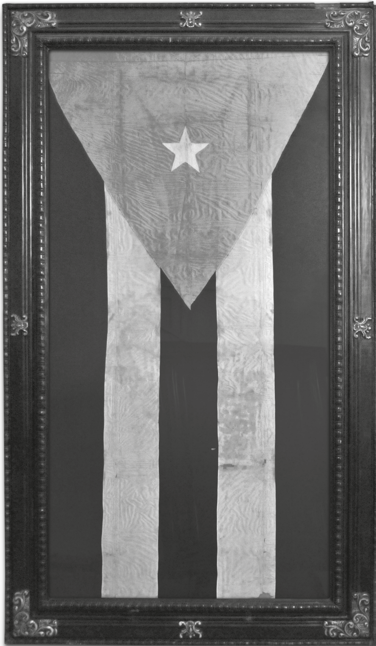
Bandera cubana enarbolada por primera vez en 1850 por Narciso López en Cárdenas, expuesta en el Museo de los Capitanes Generales en La Habana.