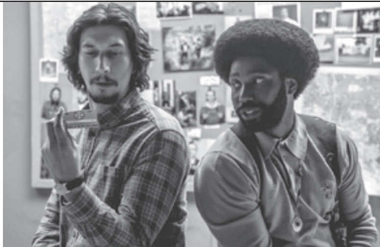
BlackKKlansman , dirigida por el cineasta estadounidense Spike Lee.

Yuli , rodada en coproducción entre España, Cuba, Reino Unido y Alemania por la directora española Icíar Bollaín, recrea momentos de la vida de Carlos Acosta, forzado, en contra de su voluntad, a descubrir sus dotes como bailarín