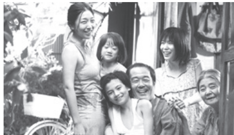
Un asunto de familia .