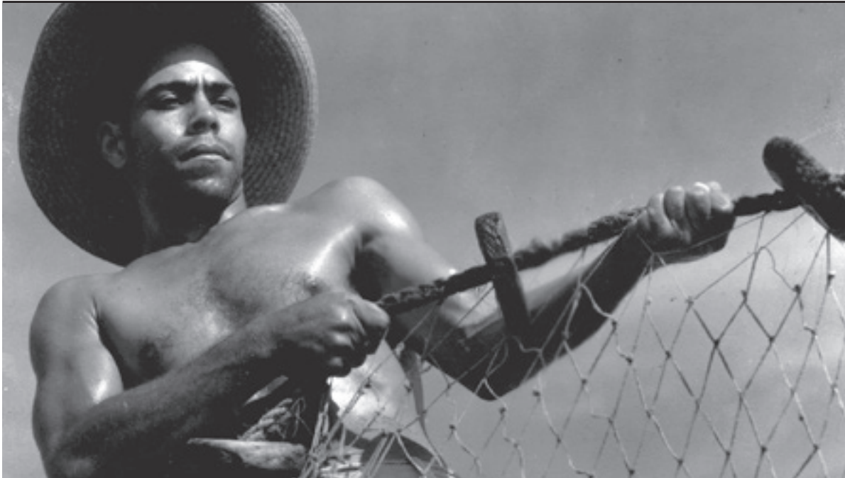
Redes será una presentación especial dentro del 40. Festival de Cine de La Habana.