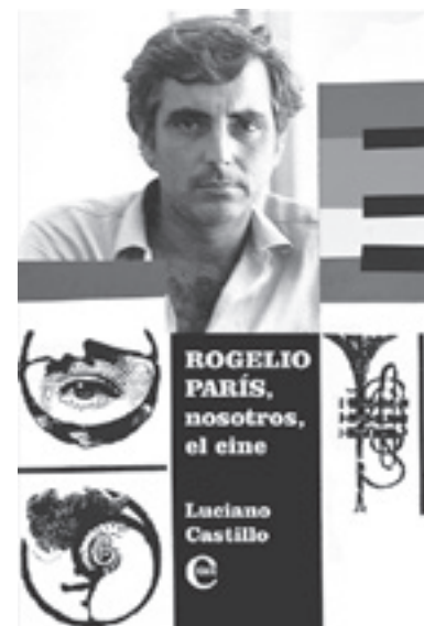
Rogelio París, Nosotros, el cine (Ed. ICAIC), de Luciano Castillo

vuelve a darnos lecciones de cine en cuanto a reconstrucción epocal, fotografía, dirección de arte y de actores, sin olvidar el fuerte soporte idéico y conceptual que comparte –la ética médica y humana; las pugnas entre religiosidad y ciencia como se sabe, muy agudas en la época; los límites a veces imperceptibles entre desarrollo científico y sacrificio propio y ajeno...–. Sin embargo, en esta ocasión el maestro baja un poco la «puntuación» a la hora de evaluar la limpieza narrativa del trayecto: la diégesis se resiente en más de un momento, se tropieza uno con planos demasiado tediosos; con secuencias morosas, de duración excesiva... Aun así, un Zanussi es siempre un Zanussi, de modo que hay que confrontarlo... LIBROS EN FESTIVAL: Rogelio París, Nosotros, el cine (Ed. ICAIC), de Luciano Castillo, es un acercamiento riguroso y extenso a la obra del inolvidable cineasta, que legó –sobre todo– notables documentales: desde el testimonio de colegas y amigos, entrevistas personales, reseñas de sus filmes, cartas y una completa biofilmografía, se va armando un retrato completo y riguroso que nos acercan al hombre y el artista. Valiosa compilación, se trata de un título que debemos adquirir... Y HASTA PRONTO, VECINOS DE LUNETAS.