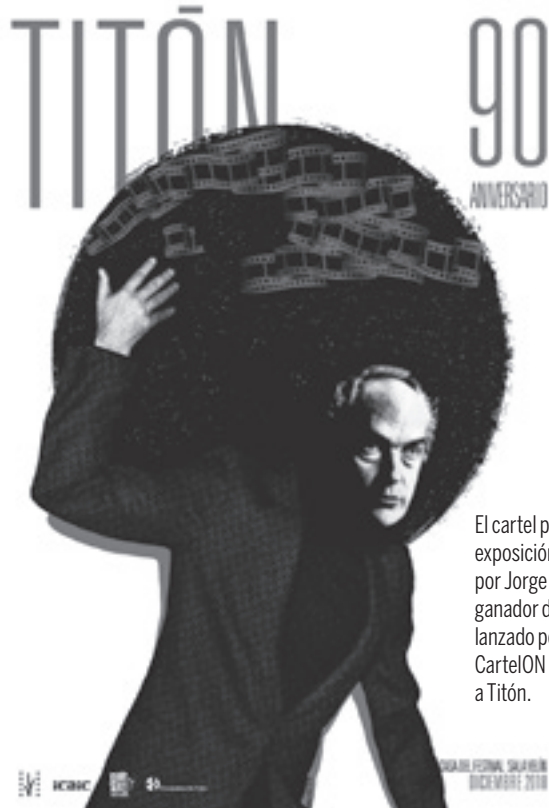
El cartel promocional de la exposición está diseñado por Jorge Félix Rodríguez, ganador del concurso, y lanzado por el proyecto CartelON para homenajear a Titón.

La exposición titulada Titón. 90 aniversario incluye una selección de carteles realizados en diferentes épocas a películas de ese maestro del séptimo arte, que escribió y dirigió más de veinte largometrajes, documentales y cortos. Lo interesante de esta muestra es que exhibe carteles confeccionados para la promoción de los filmes en el instante de su estreno y otros hechos años después. Por ejemplo, Una pelea cubana contra los demonios tiene el cartel –de finales de 1971– para el momen-